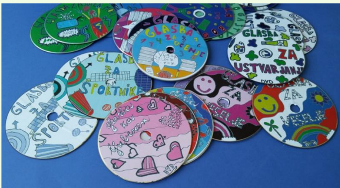
likovna naloga: Beseda in risba