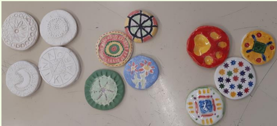
Likovna naloga: Izdelava glaziranega izdelka iz gline