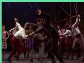
America iz West side story (Zgodba z zahodne strani)