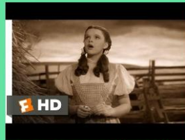
Somewhere over the rainbow iz Wizard of Oz (Čarovnik iz Oza)