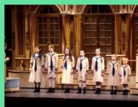
Do-re-mi iz The sound of music (Moje pesmi, moje sanje)