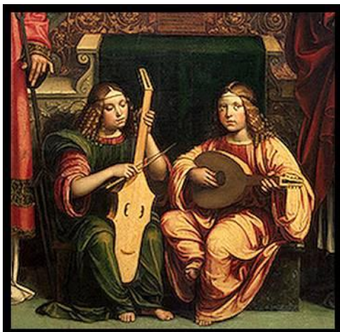
VIOLA DA GAMBA in LUTNJA