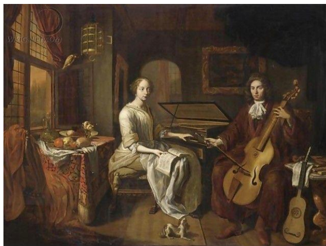
VIRGINAL in VIOLA DA GAMBA

Izpopolnjevanje inštrumentov je spodbujalo skladatelje, da so ustvarjali glasbene oblike za solistične inštrumente in orkestre. Priljubljeno ciklično glasbeno delo, za katerega je značilno, da je to skladba, ki je posebna celota, sestavljena iz določenega niza samostojnih stavkov je bila suita , ki nastane v 16. stoletju. V začetku je bila suita dvodelna plesna skladba za lutnjo. Plesi so se spreminjali, dokler niso določili leta 1640 točno zaporedje plesov: Allemanda (zmerno hiter nemški ples), Couranta (francoski tridobni dvorni ples), Sarabanda (počasen španski ples) in Gigua (živahen škotsko-irski ples).